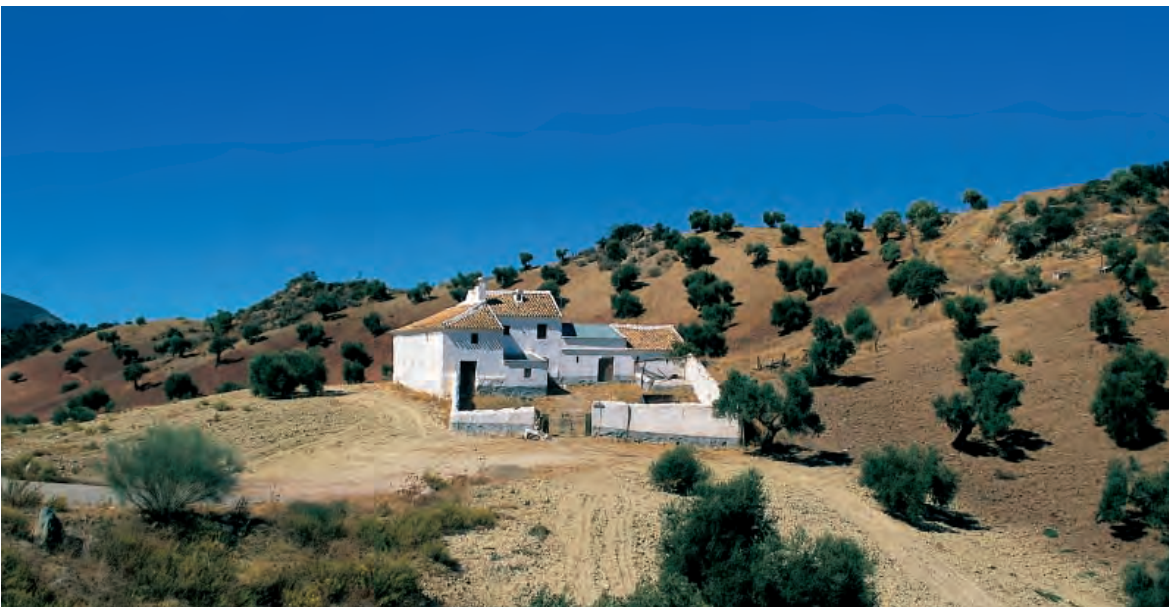
Cortijo en Jaén.

Halla su respuesta en los temas 9 y 10 del libro de texto.